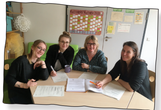
Mitarbeitende „Lernstuben“ Erlangen, 2018