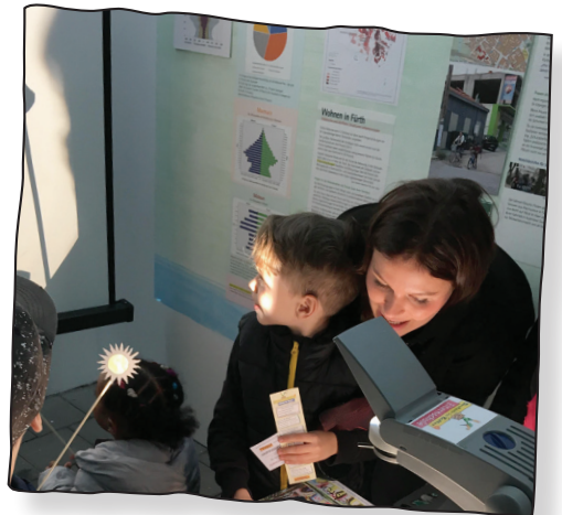
Interkulturelles Schattentheater von Stiftung Sozialidee, 2018

Unser mehrsprachiges Schattentheaterstück kommt gegen Spende in Kitas, Schulen, Geflüchtetenunterkünfte, Feste etc. Wir können das Stück in Arabisch, Türkisch, Kurdisch, Spanisch, Amharisch, Tigrinya, Russisch, Asserbaidschanisch, Arabisch, Italienisch, Rumänisch, Hausa oder in Polnisch aufführen.