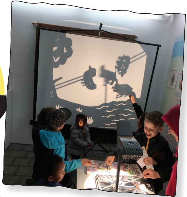
Design: Rebecca Prell

Stiftung Sozialidee gÜmbH • 90482 Nürnberg • Registergericht: Nbg HRB 26937 kontakt: Mail: hallo@stiftung-sozialidee.de • Web: www.stiftung-sozialidee.de